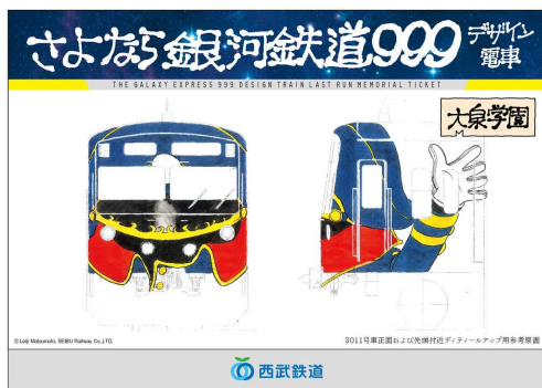
「大泉学園版」台紙(表紙)