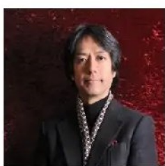
■柳澤 寿男 (指揮者)

1972年結成。来年創立50周年を迎える。一人一人がソリストの個性派揃いの合奏団。定期公演、特別公演、室内楽コンサート、子どものためのコンサート等を主催すると同時に、各地ホール・テレビ・ラジオ・芸術祭等に多数出演している。「クオリティは高く、ステージは楽しく」というポリシーを持ち、クラシック音楽の他に日本の伝統芸能とのコラボレーションや、俳優、タレント、落語家、漫才師等の異分野との共演も積極的にこなしている、「挑戦する室内オーケストラ」と大好評を博している。