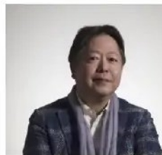
■Takekawa ユキヒデ (音楽家/ゴダイゴ)

1971年生まれ。パリ・エコール・ノルマル音楽院オーケストラ指揮科に学ぶ。また指揮を佐渡裕、大野和士の各氏に師事。2000年東京国際音楽コンクール<指揮>第2位。海外では2005-07年マケドニア旧ユーゴスラヴィア国立歌劇場首席指揮者を務め、2007年UNMIK統治下のコソボ自治州においてコソボ・フィルに客演し、10月常任指揮者に就任。2007年バルカン民族共栄を願うバルカン室内管弦楽団を設立。その活動は話題を呼び、数多くのメディアで報道され続けている。バルカン室内管弦楽団音楽監督、コソボ・フィル首席指揮者。2019年コソボ大統領勲章受章 2020年京都フィルハーモニー室内合奏団ミュージックパートナー。