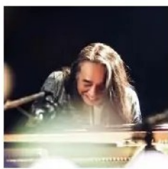
■小島 良喜 (ジャズピアニスト)

5歳からバイオリン、10歳から作曲を始める。1975年東京外国語大学在学中に全曲英語詞のアルバム「走り去るロマン」でソロアーティストとしてデビュー。翌76年にゴダイゴ結成。ボーカルと作曲を担当し「ガンダーラ」「モンキーマジック」「銀河鉄道999」「ビューティフルネーム」など、数多くのヒット曲を生む。80年代以降もヒットメーカーとして、アーティストへの楽曲提供や、映画音楽にCMソング・主題歌等を数多く手掛ける。現在は音楽活動の他、エッセイなどの執筆活動、テレビ・ラジオ番組への出演や講演・コンサート活動と幅広く活躍中。2006年には結成30周年を機にゴダイゴも恒久的再始動を宣言する。詳しくはオフィシャルHP https://www.takekawayukihide.com/