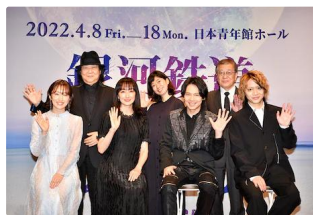
「銀河鉄道999 THE MUSICAL」制作発表会の様子。【拡大】