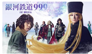
「銀河鉄道999 THE MUSICAL」メインビジュアル【拡大】