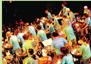
パノラマ・スティール・オーケストラ