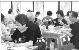
さまざまなクラブがあります(写真は絵手紙)