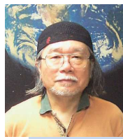
銀河鉄道999作者 / 松本零士